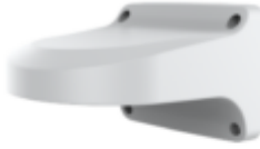
A29 A29 WALL MOUNT