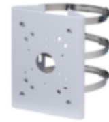
A36 POLE MOUNT