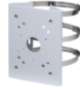
A36 POLE MOUNT