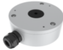
TC-P54BM SPEC: V5 JUNCTION BOX