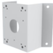
A35 CORNER MOUNT