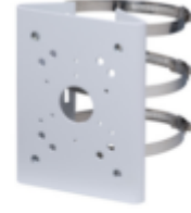
A36 POLE MOUNT